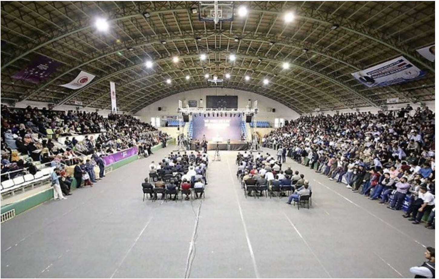
Sosyal Doku Vakfı'nın yüzbinlerce 'gönüllüsü' bulunuyor.