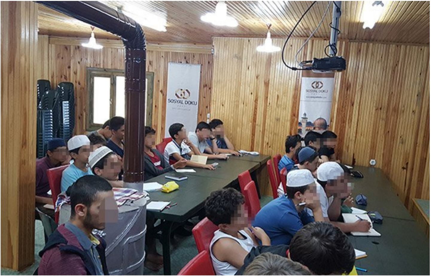
Vakıf özellikle çocuklara yönelik 'etkinlikleri' ile dikkat çekiyor

Sosyal Doku Vakfı, çalışmalarında ise şu temel karakteri esas aldığı savunuluyor;