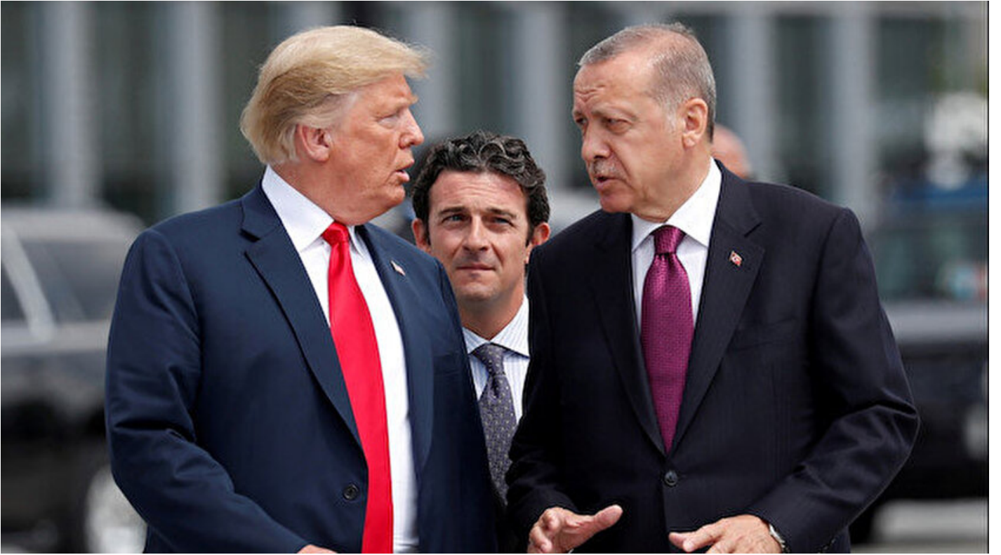
ABD Başkanı Trump ile Cumhurbaşkanı Recep Tayyip Erdoğan