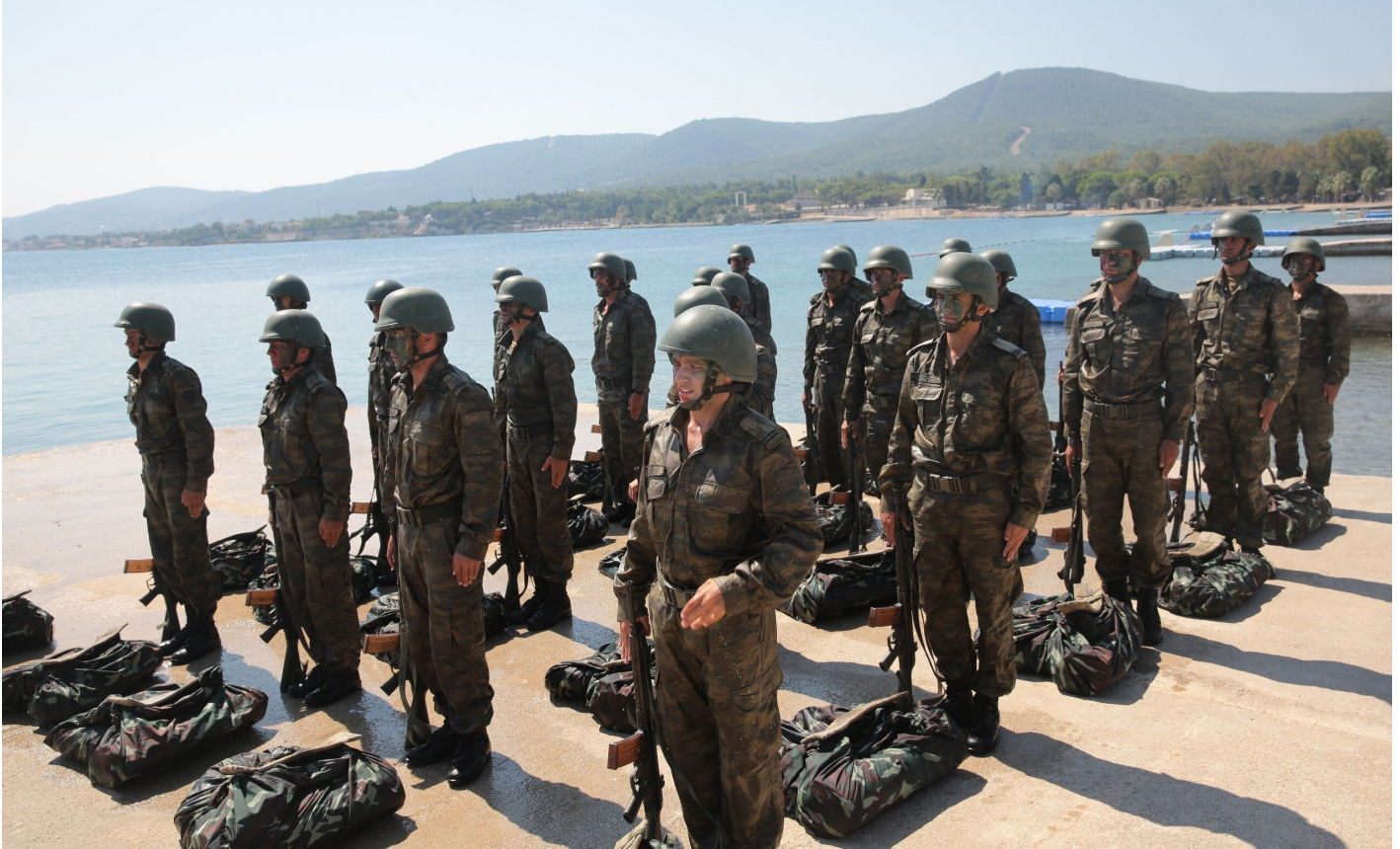
Eğitim gören askerler.

"Bizi sindirmek için FETÖ mensubu sözde subaylar insanlık onuruna ve üniformanın şerefine yakışmayacak eylem ve söylemlerde bulundular. Şimdiye kadar pek çok haberde ve kitapta bu işkenceler yazıldı, çizildi. FETÖ mensubu olmayan bizlere bunlar uygulanırken, geri kalanlar askeri eğitim kampını adeta yaz tatili gibi geçirmekteydi.