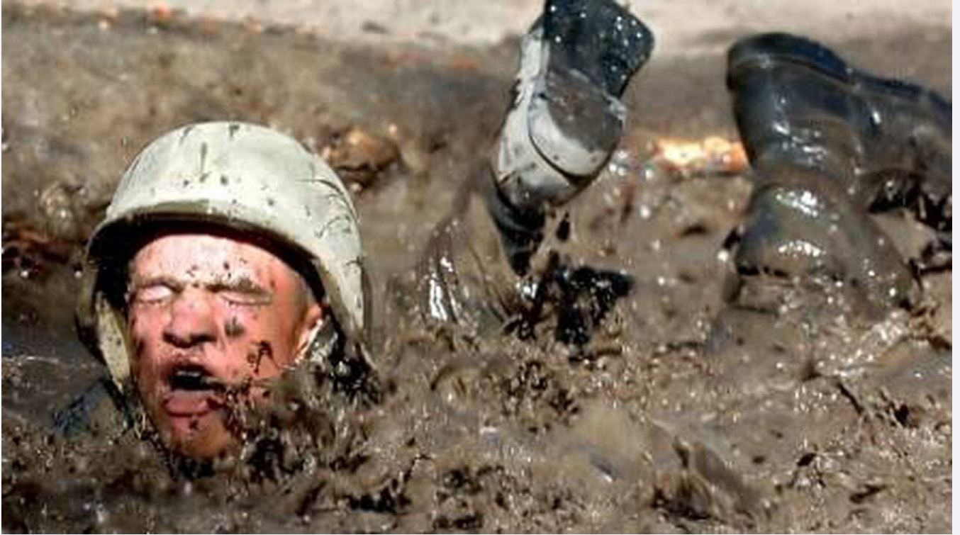
Şok mangası adı altında askerlere her türlü işkence yapıldığı bilgisi ilk kez mahkeme tutanaklarına da geçti. Fotoğraf: eğitim sırasında çamurda yatan bir asker.

çelik. Şimdi de FETÖ'ye değil, FETÖ'cülere mücadele ediyoruz. Onu da yarım yamalak yapıyoruz.