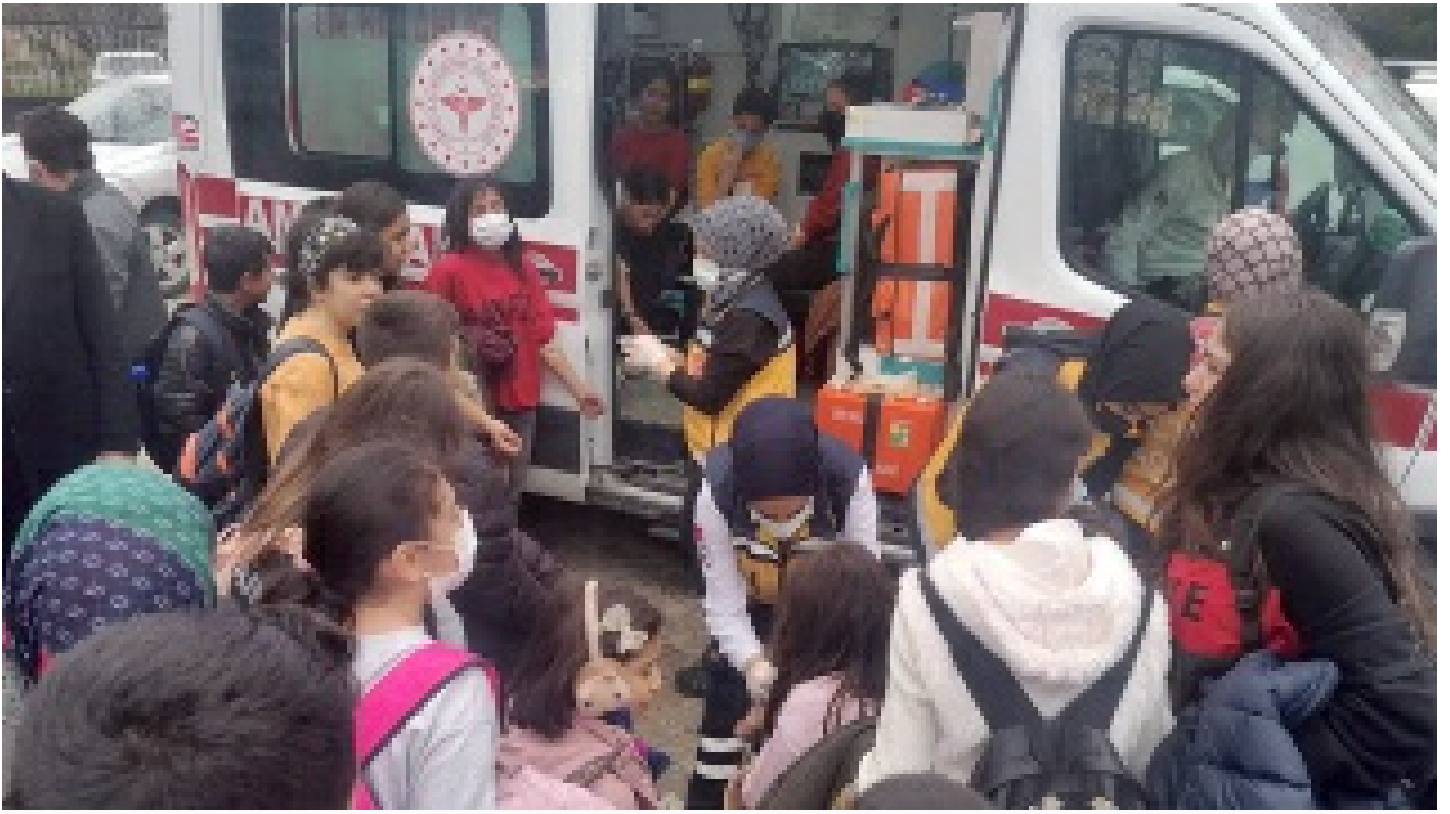
70 öğrenci hastaneye kaldırıldı