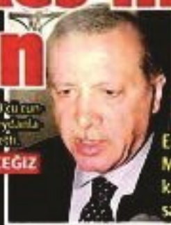
Erdoğan'ın Marmaris'te kaldığı otele saldırı

Erdoğan: Milleti meydanlarda karşılamakla topluluğa ve fonda rını o azlık grubu tanklarıyla top laryla gelmelerini raporaklarına ha