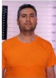
2 NOLU FOTOĞRAF

1 nolu fotoğrafta gösterilen 143 filo koridor güvenlik kamerası CH7 2016-07-16-03-33-03 serinolu görüntünün 03.22.11 ile 03.22.23 zaman aralığındaki görüntüsünde koridor içerisinde görülen şahıs ile 2 nolu fotoğrafta Olav Yeri İnceleme Sube Müdürlüğünde