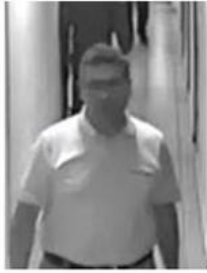
1 NOLU FOTOĞRAF

03.08.2017 - 19:25 || Son Güncelleme : 03.08.2017 - 19:25