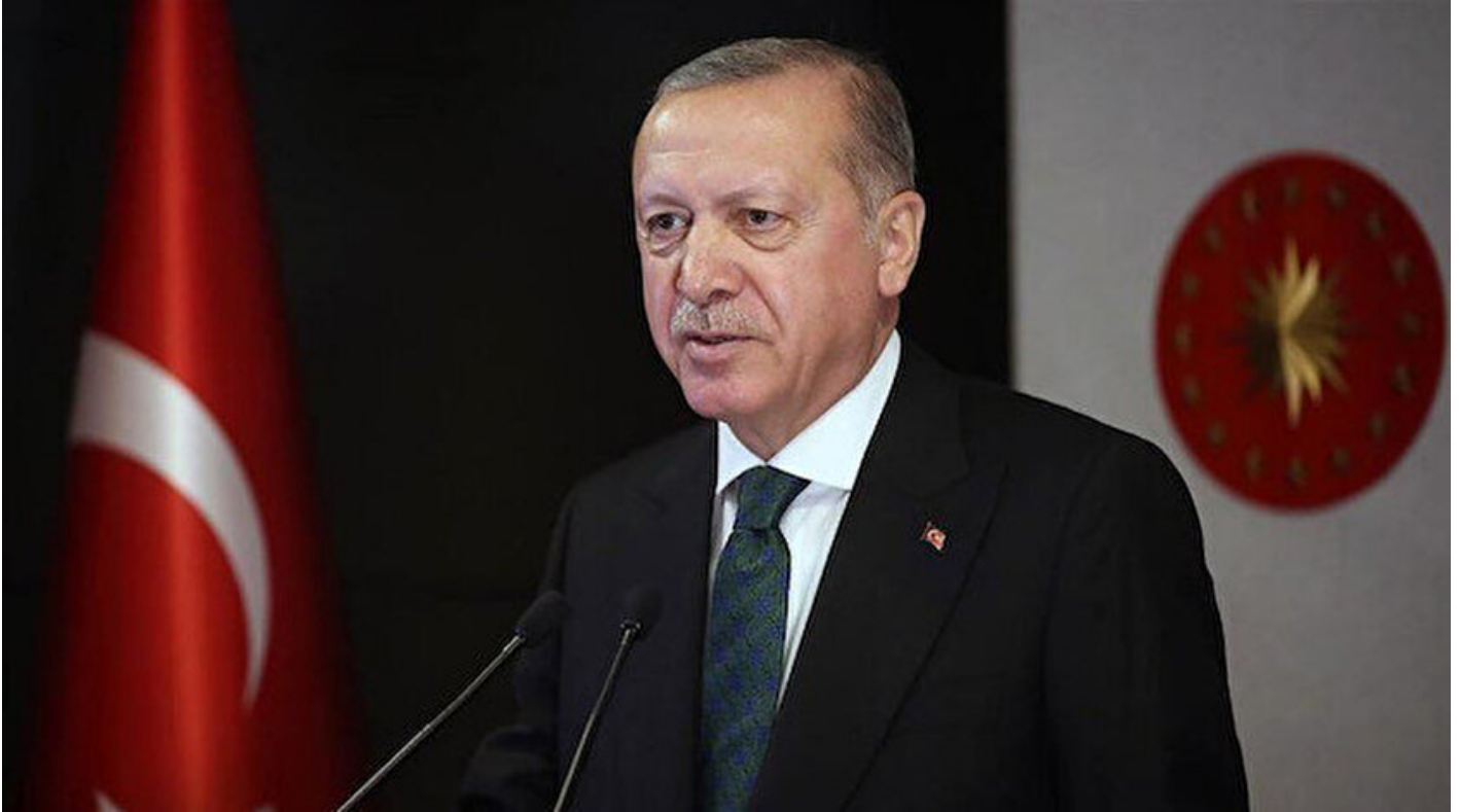
Cumhurbaşkanı Recep Tayyip Erdoğan.