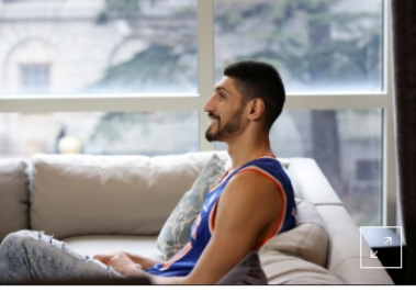
Slideshow (4 Images)

A representative of the Turkish embassy in Washington directed queries about Kanter's comments to the Turkish foreign ministry. The foreign ministry did not immediately respond to a request for comment.