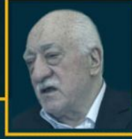
Fetullahçı Terör Örgütü elebaşı FETULLAH GÜLEN