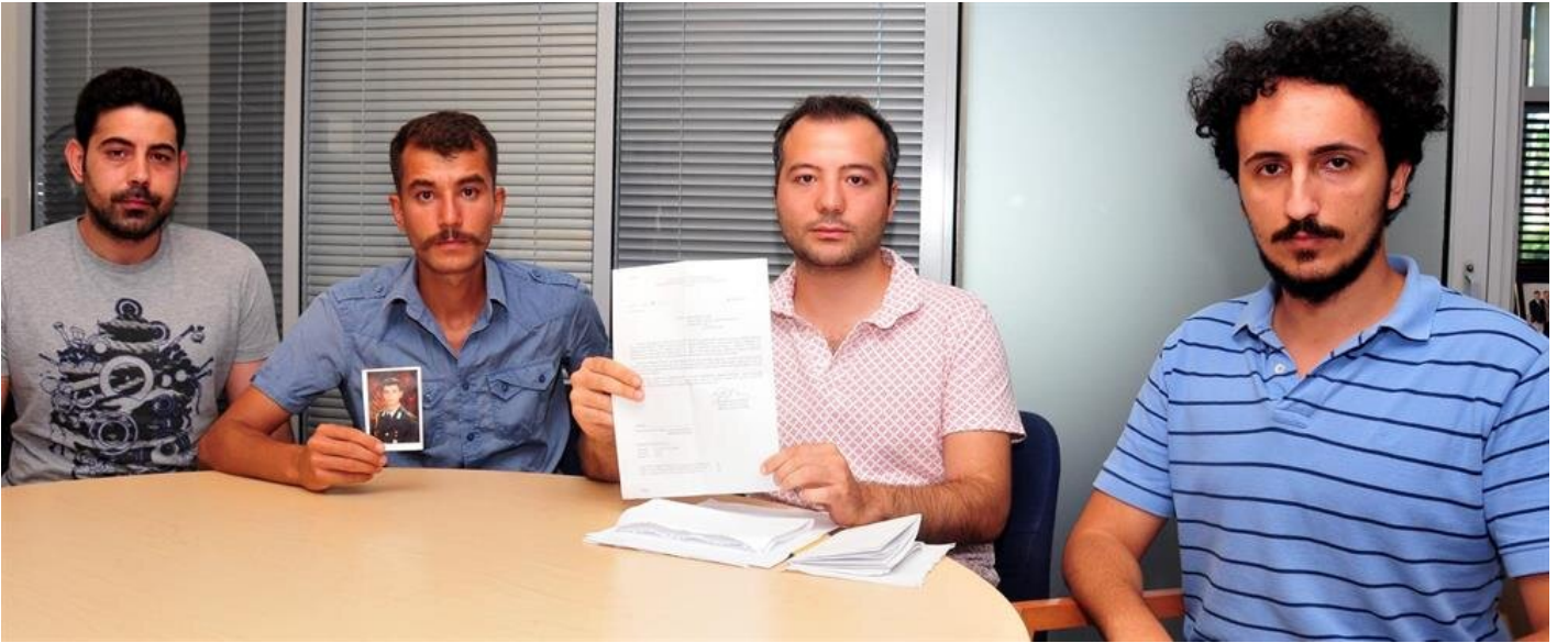
Mağdur Harbiye öğrencileri çarpıcı açıklamalarda bulundu.