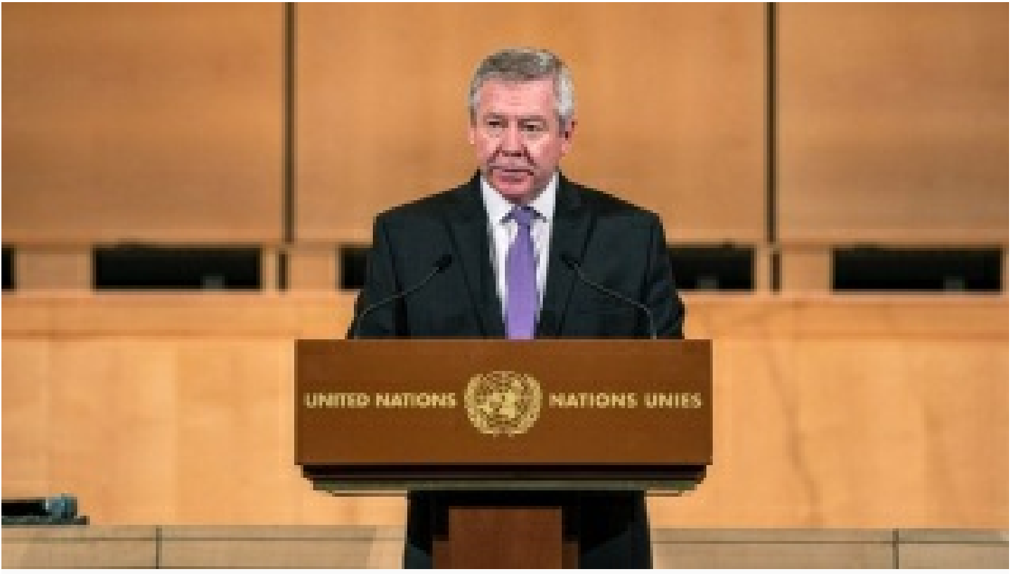
Rusya'dan, Türkiye'nin 'müzakere' teklifine olumlu yanıt