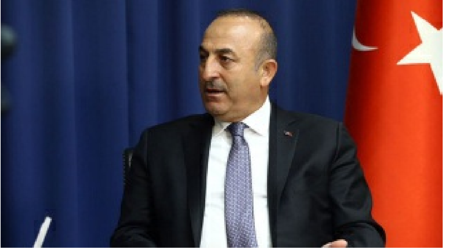
Çavuşoğlu: Rusya ve Ukrayna'yı Antalya'da görüştürmek istiyoruz