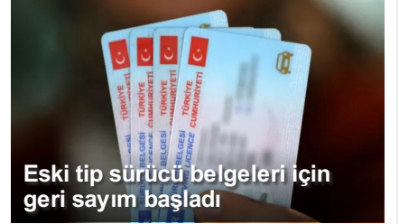
Eski tip src belgeleri iin geri sayım bařladı