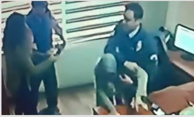
Yardım istedi, darbedilerek dışarıya atıldı