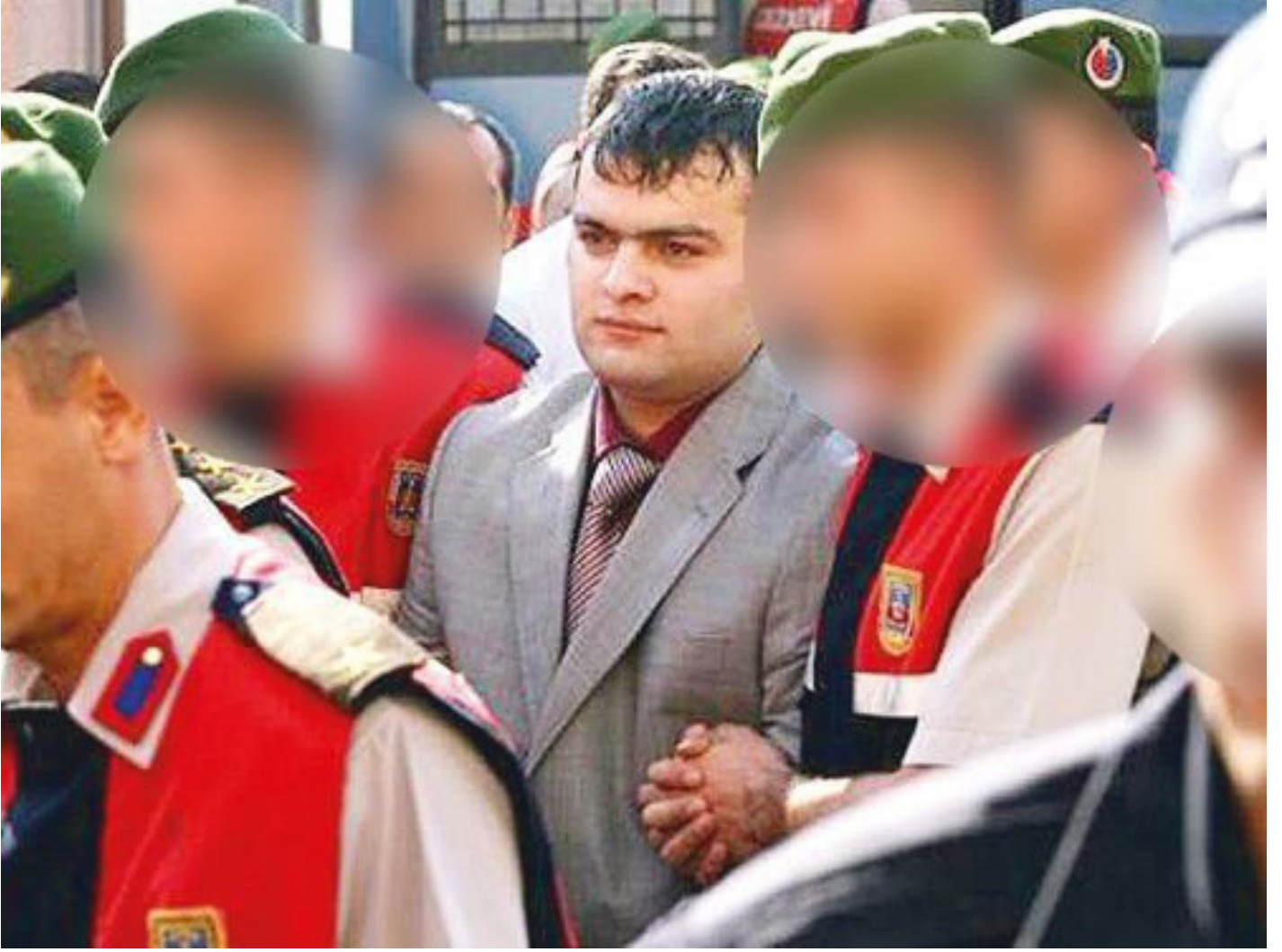
Hrant Dink'in katili Ogün Samast.