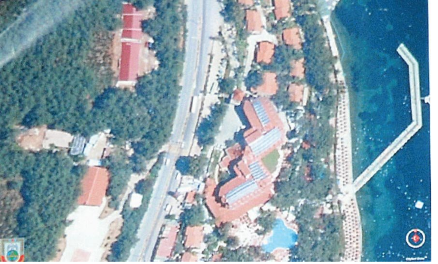
Erdoğan'ın kaldığı otelinin bulunduğu şerit böyle fotoğraflanmış.