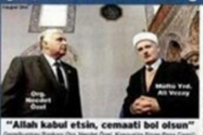
"Allah kabul etsin, cemaati bol olsun"