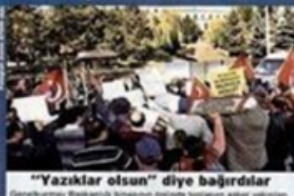
"Yazıklar olsun" diye bağırıyorlar