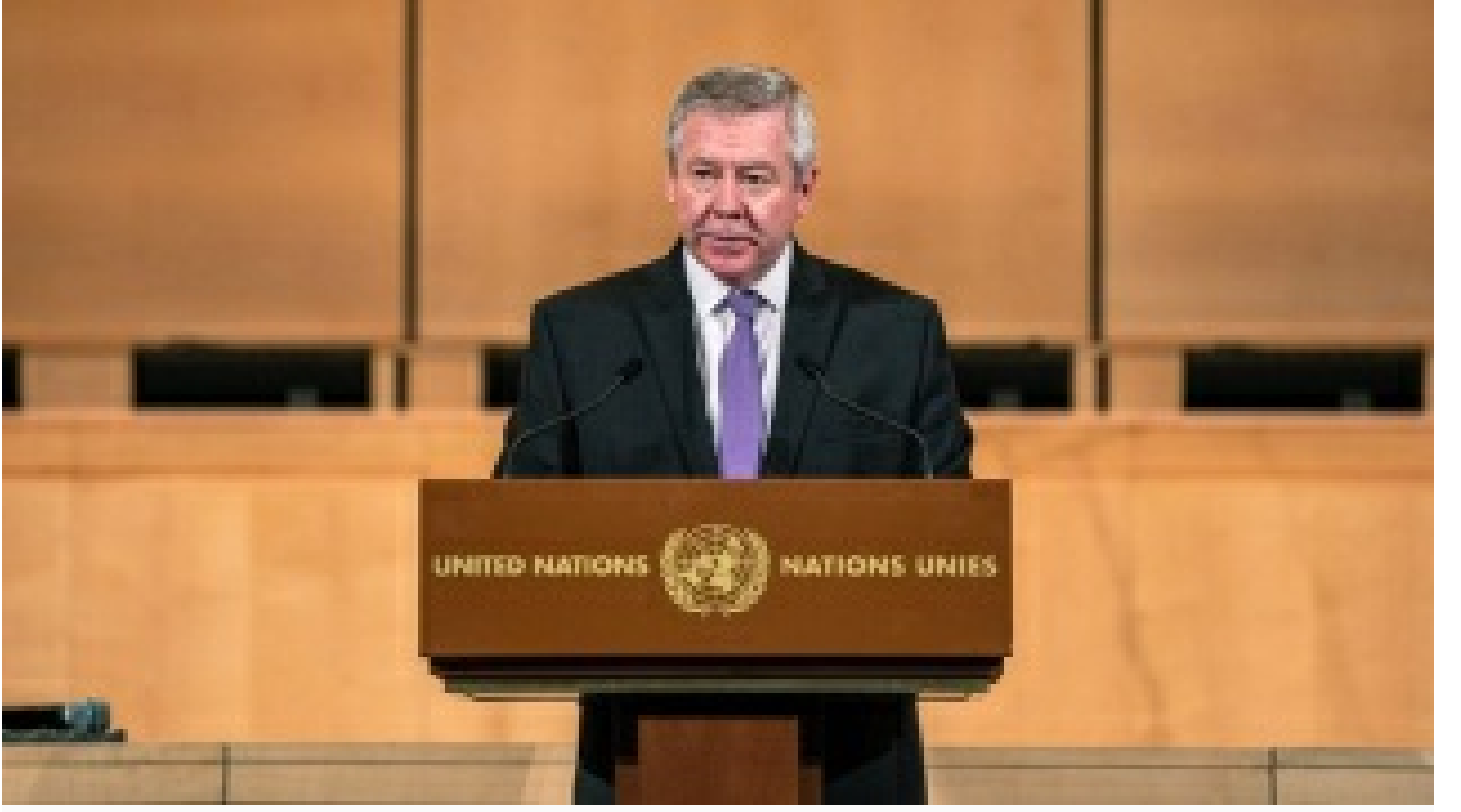
Rusya'dan, Türkiye'nin 'müzakere' teklifine olumlu yanıt