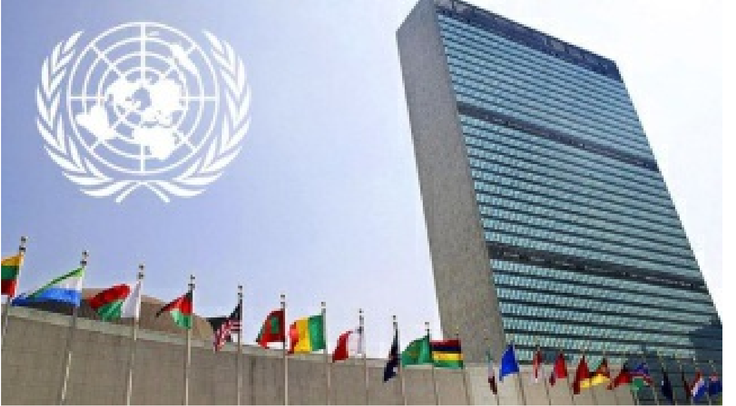
BM'den 'nükleer felaket yaşanmaması' çağrısı