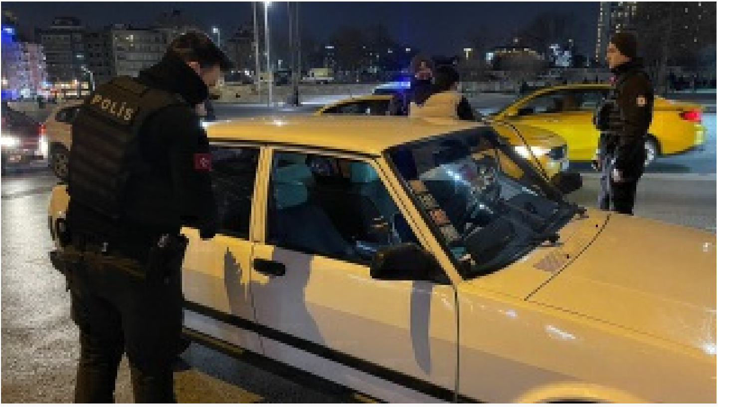
İstanbul'da "Yeditepe Huzur" asayiş uygulaması