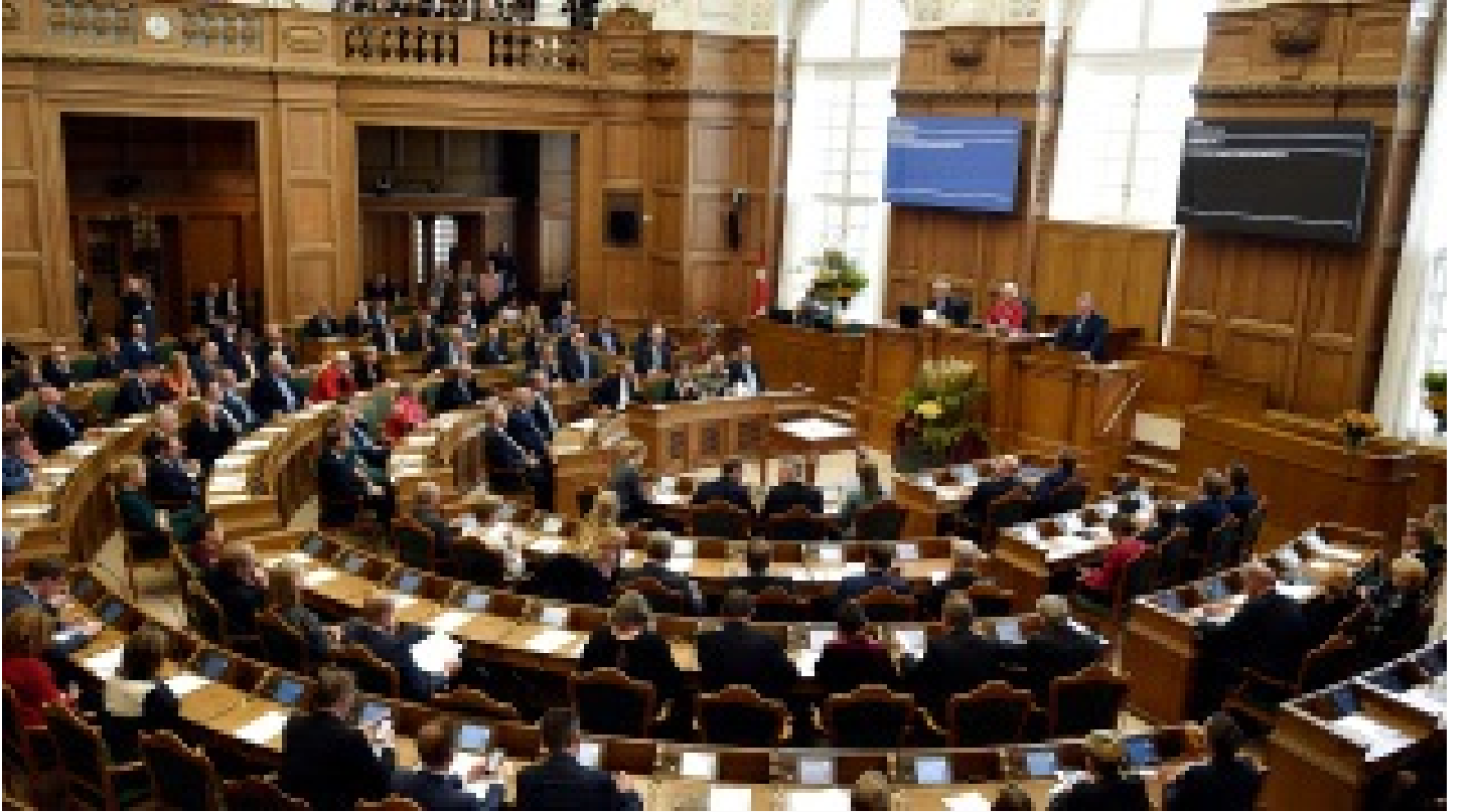
Danimarka Suriyelilere uyguladığı mücevher yasasını Ukraynalılara uygulamayacak