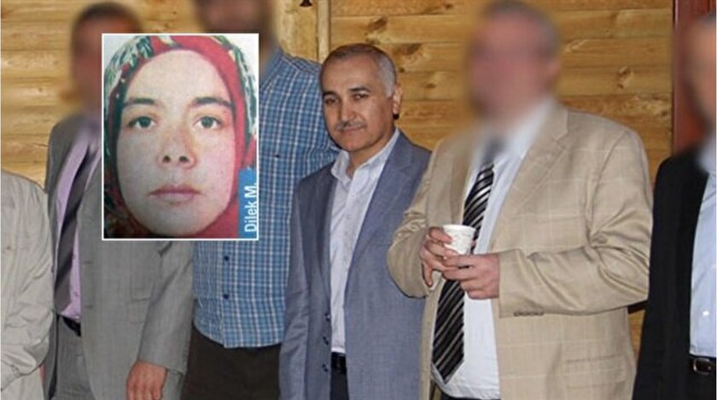
Firari FETÖ'cü Adil Öksüz

Haber Merkezi · 27 Ağustos 2018, 10:27 · Son Güncelleme: 27 Ağustos 2018, 10:44 · Diğer