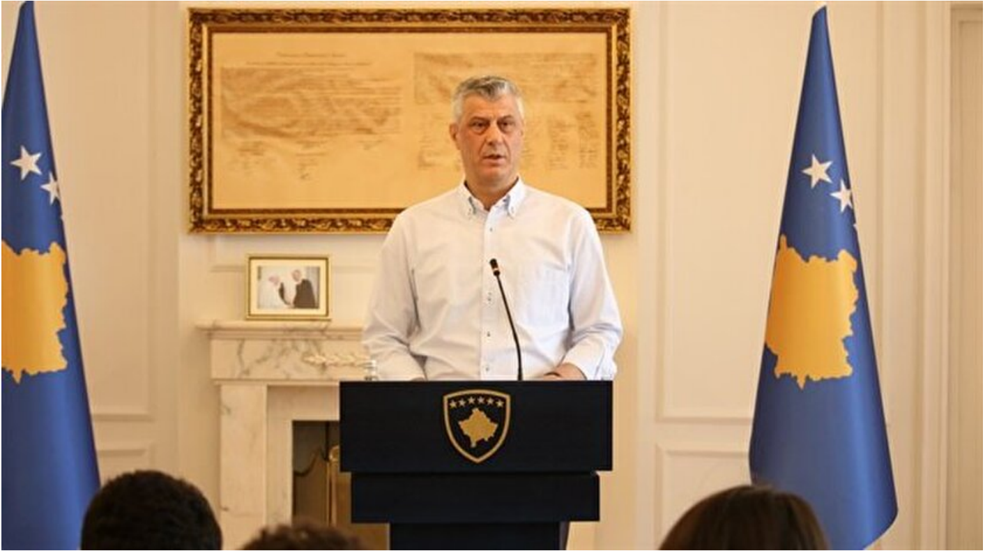
Kosova Cumhurbaşkanı Haşim Taçi

Haber Merkezi · 31 Mart 2018, 21:28 · Son Güncelleme: 31 Mart 2018, 21:40 · AA