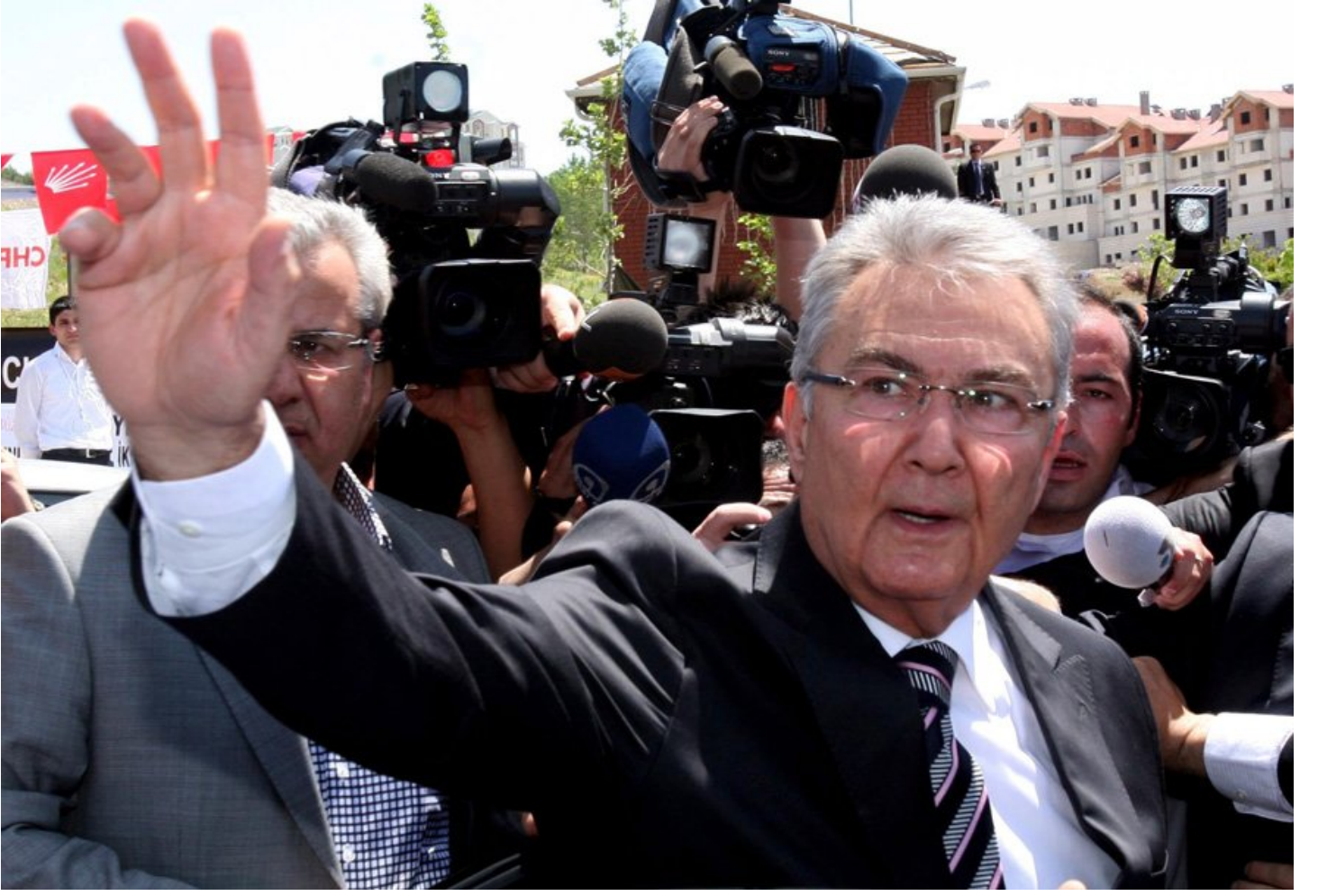
CHP'nin eski lideri Deniz Baykal 10 Mayıs 2010'da istifa etmiş ve genel merkez binasından böyle ayrılmıştı.