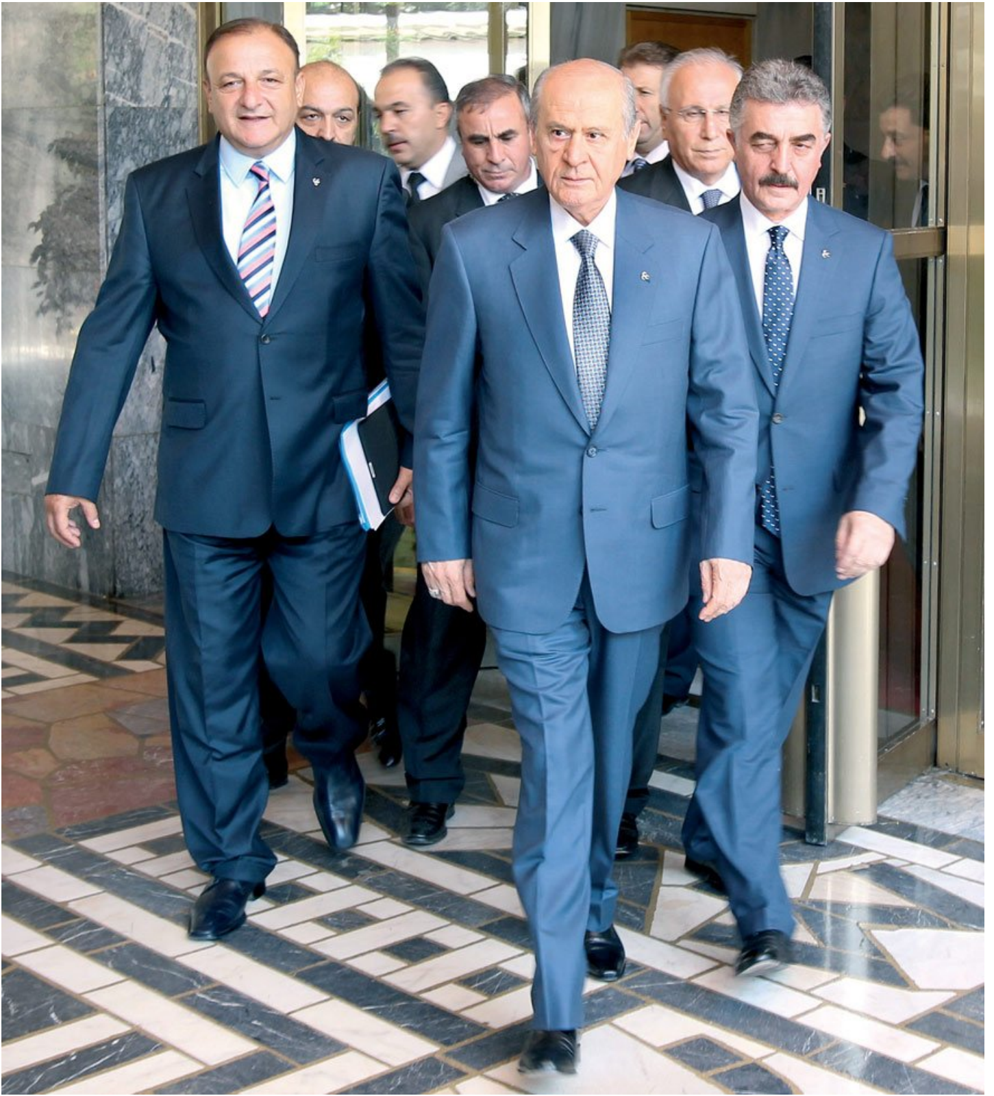
MHP lideri Bahçeli kumpasında FETÖ'ye tavrı almıştı.