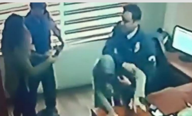
Yardım istedi, darbedilerek dışarıya atıldı