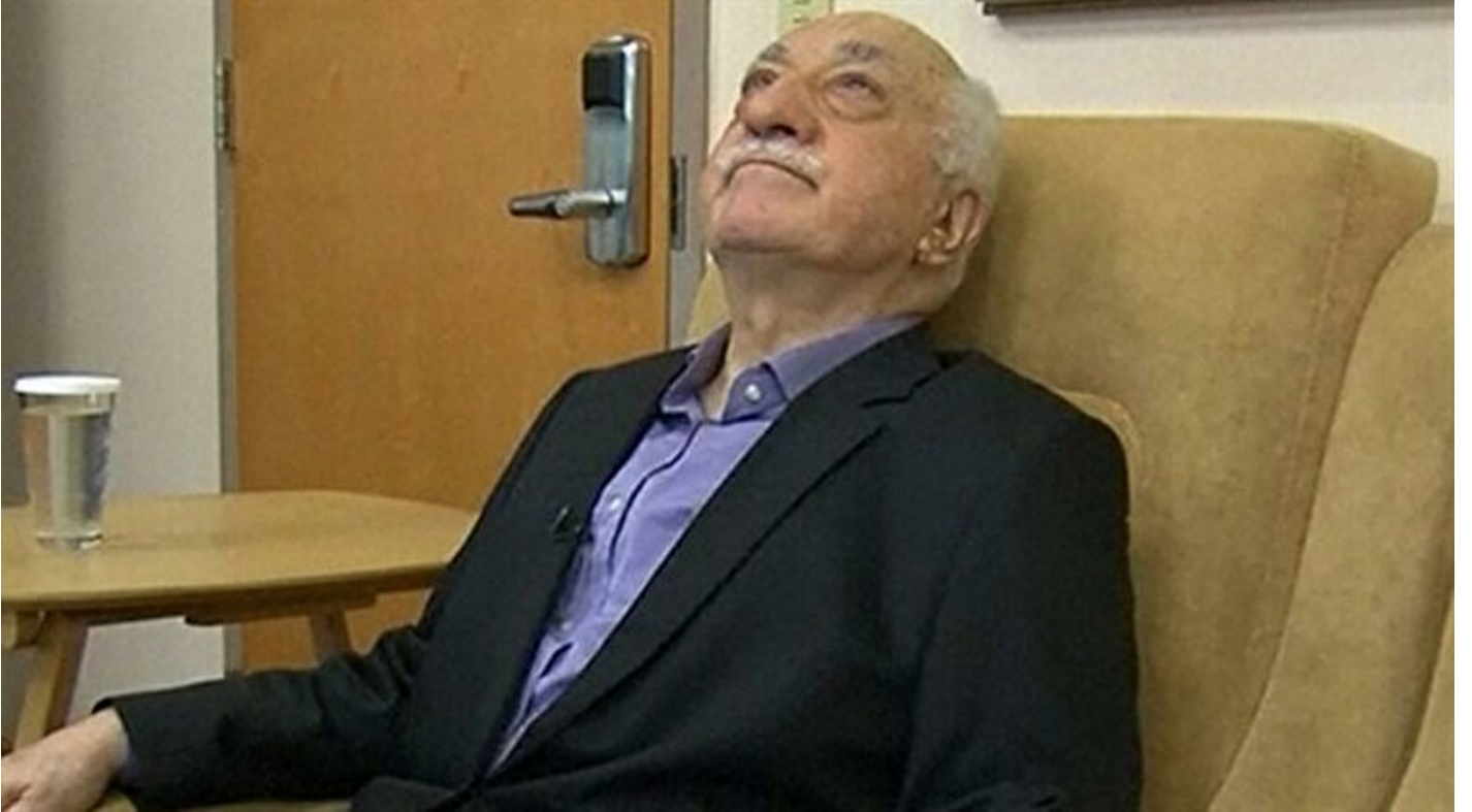
FETÖ elebaşı Fetullah Gülen

Haber Merkezi · 28 Şubat 2017, 11:37 · Son Güncelleme: 28 Şubat 2017, 11:47 · AA