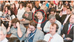
Öksüz'ün 4 yıl önceki fotoğrafı olay oldu! Bakın neredeymiş