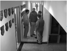
Akıncı Üssü'ndeki 5 sivil FETÖ'cü savcılık tüm detayları çözdü