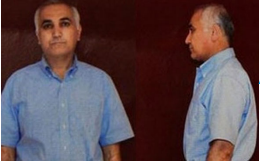
Adil Öksüz'ü o gece arayan ülke tespit edildi