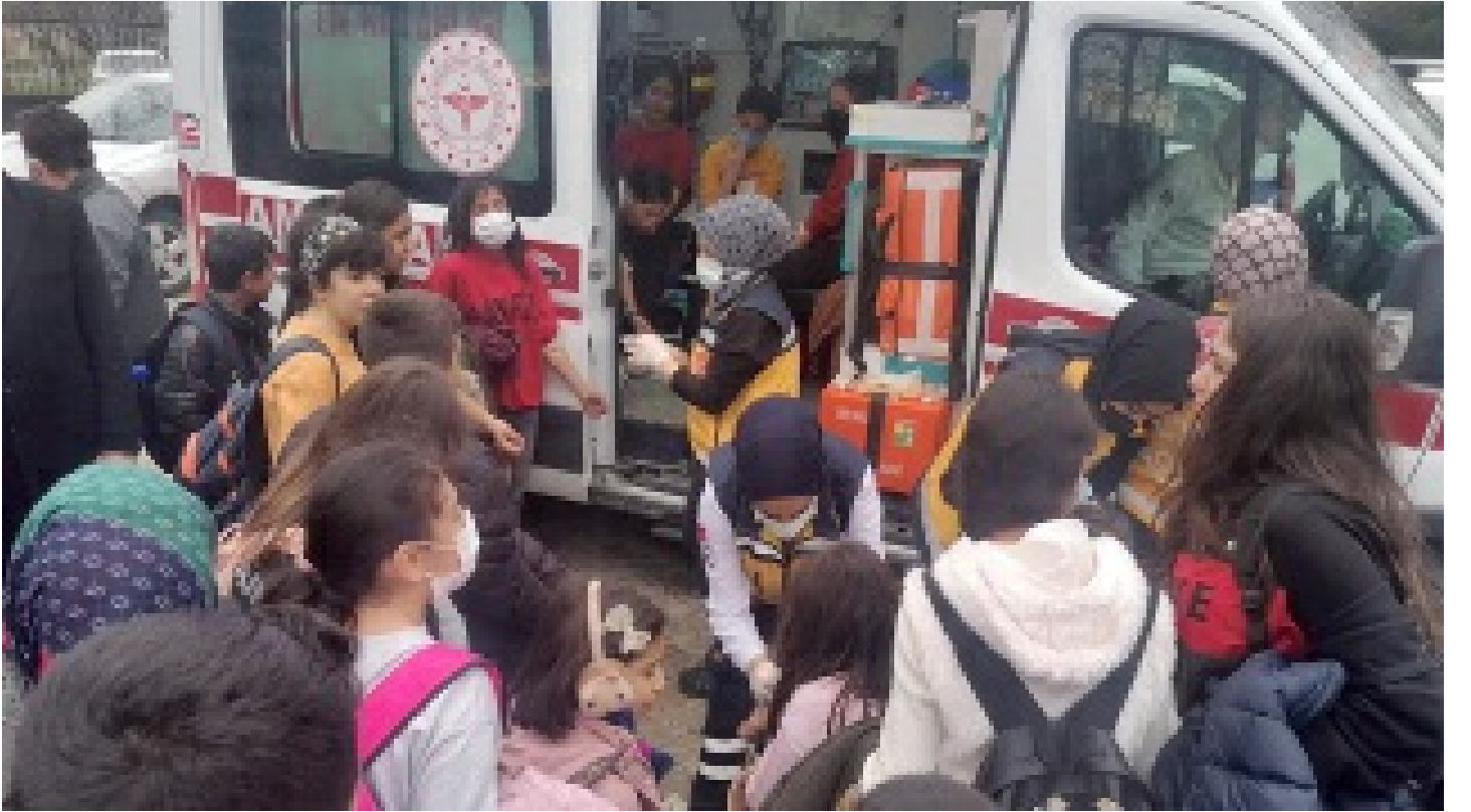
70 öğrenci hastaneye kaldırıldı