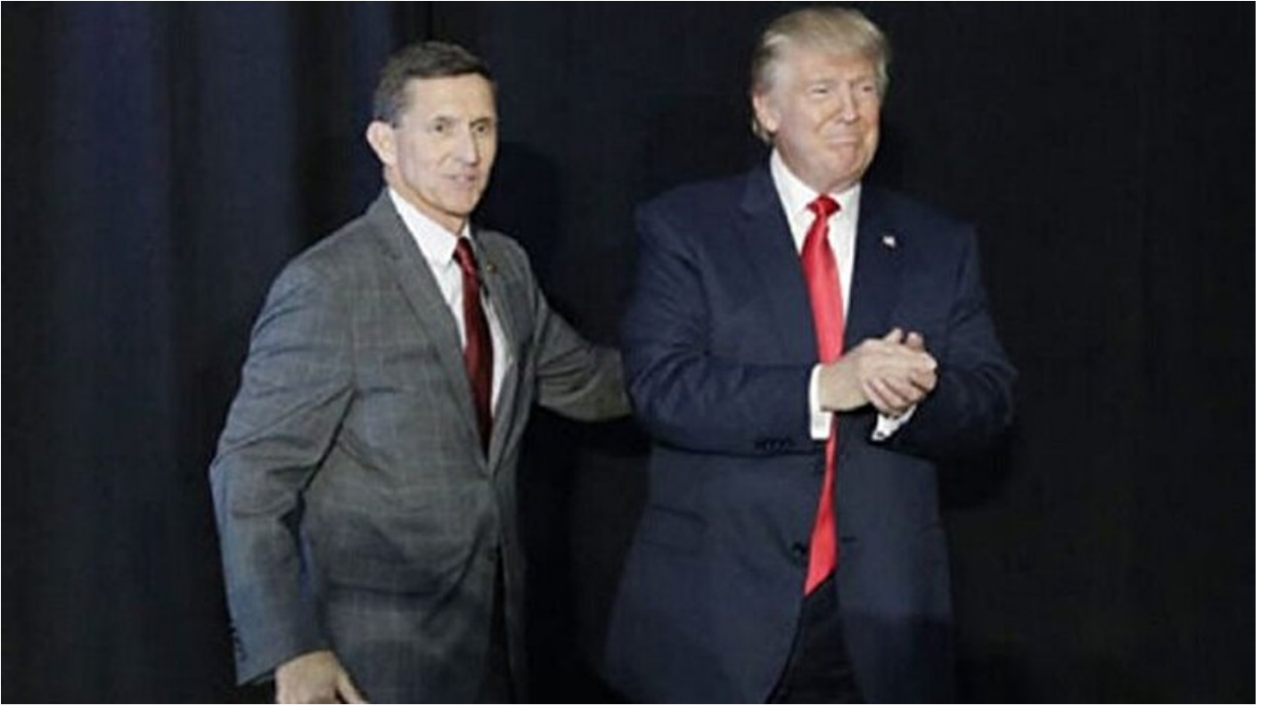
ABD'nin 45'inci başkanı Donald Trump ve Başdanışmanı Michael Flynn

Haber Merkezi · 10 Kasım 2016, 07:41 · Son Güncelleme: 10 Kasım 2016, 10:47 · AA