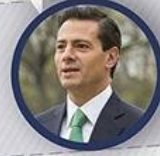
MEKSİKA CUMHURBAŞKANI ENRIQUE PENA NIETO

Trump'ı, Alman Nazi lideri Adolf Hitler'e benzetmişti