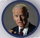
ABD BAŞKAN YARDIMCISI JOE BIDEN

"Dış politikada cahil ve ABD'nin dış politikasına ciddi tehdit. Bu adama nükleer silahların şifrelerinin verildiğini düşünsenize"