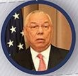
ESKİ DIŞİŞLERİ BAKANI COLIN POWELL

"Ülke için utanç kaynağı ve ulusal bir felaket"