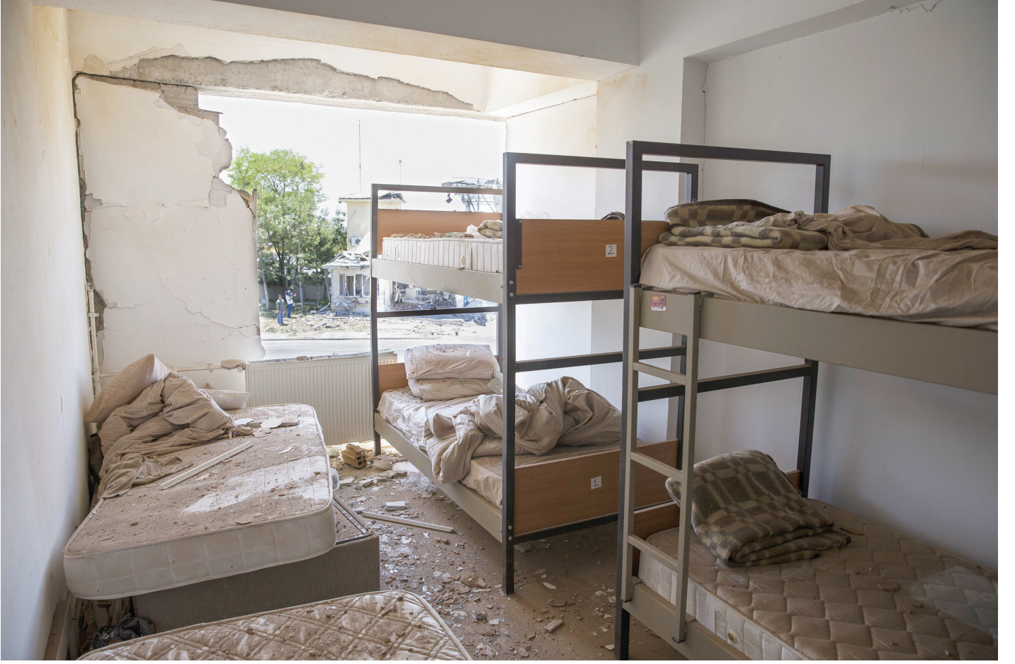
Birçok Özel Harekatçı, uykudayken mermi ve bombaların hedefi oldu.