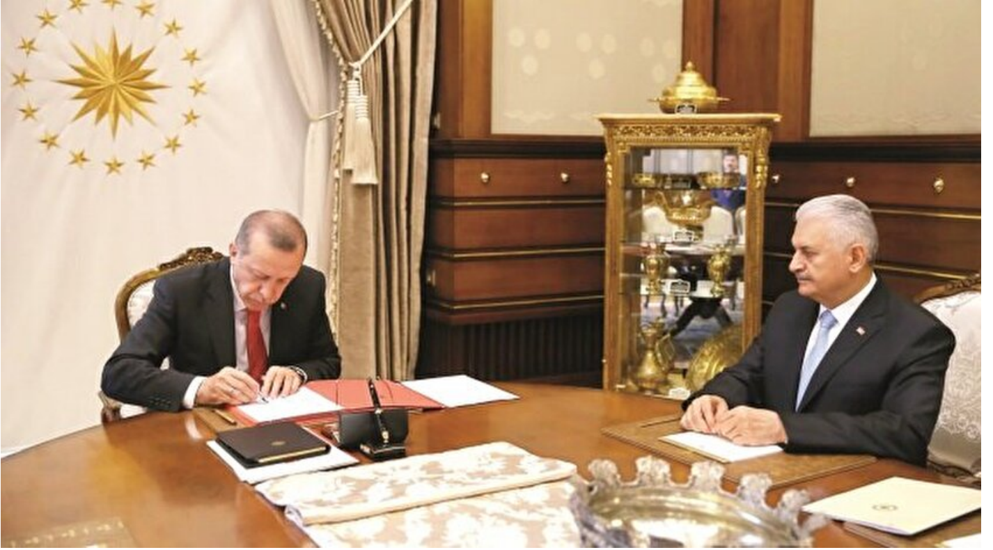
Cumhurbaşkanı Erdoğan ve Başbakan Binali Yıldırım