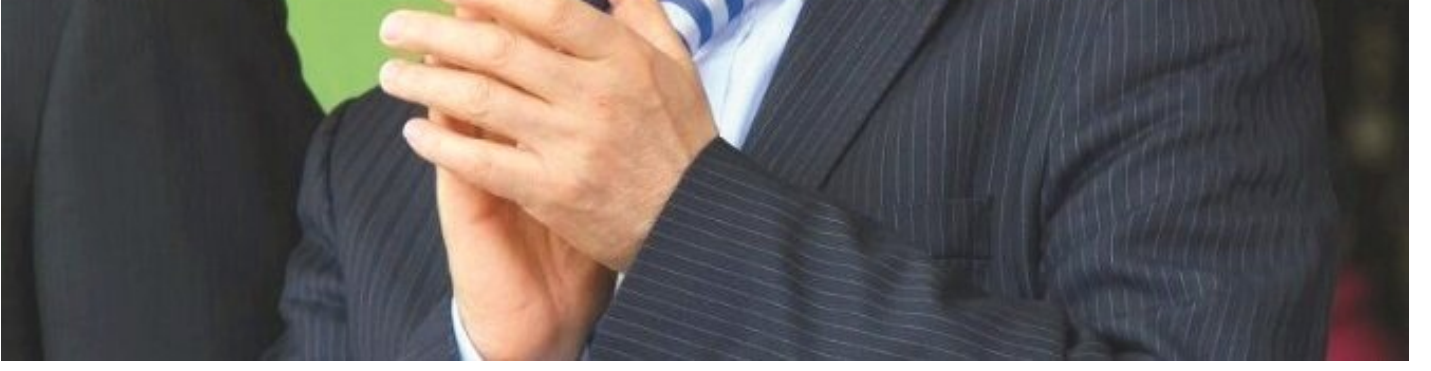
Ahmet Eşref Fakıbaba