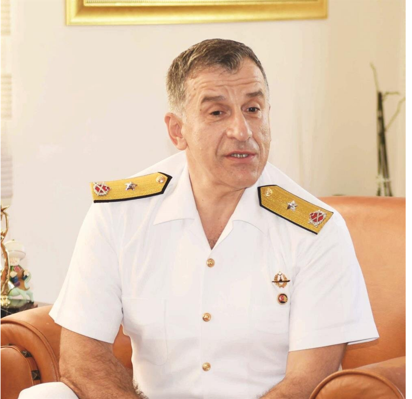
Tuđamiral Ali eki

Milli Savunma Bakanlıđı'na dün yapılan açıklamada, atama alıřmaları öncesi, 7 general ve amiralin kendi istekleriyle emeklilik talebinde buldukları ve yapılan deđerlendirme sonucu bařvuruların 18 Ađustos 2017 tarihinde onaylandıđı açıkladı. 7 general/amiral için herhangi bir atama yapılmaksızın emeklilik kararı verildi. Edinilen bilgiye göre, emekli edilen isimlerin çođunun yakın aile evresi ve akrabalarında ByLock tespit edildi. Sözkonusu general ve amirallerin de bu Őüphe üzerine emeklilik kararı aldıkları konuşuluyor. Emekli edilen generallerin biri 'tüm', 6'sı ise 'tuđ' seviyesinde. Tuđgeneral ve tuđamiral rütbesindeki 6 ismin tamamı da 15 Temmuz sonrası terfi etmiřlerdi.