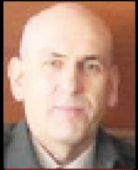
■ 3. Ordu Komutanlığı Yarbaşkanı Tuğgeneral Ömer Karaimamoğlu