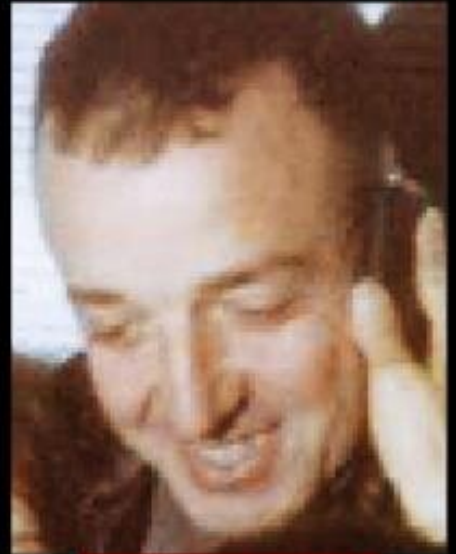
■ D.K.K. Teknik Başkanı Tuğamiral Necmi Yıldırım