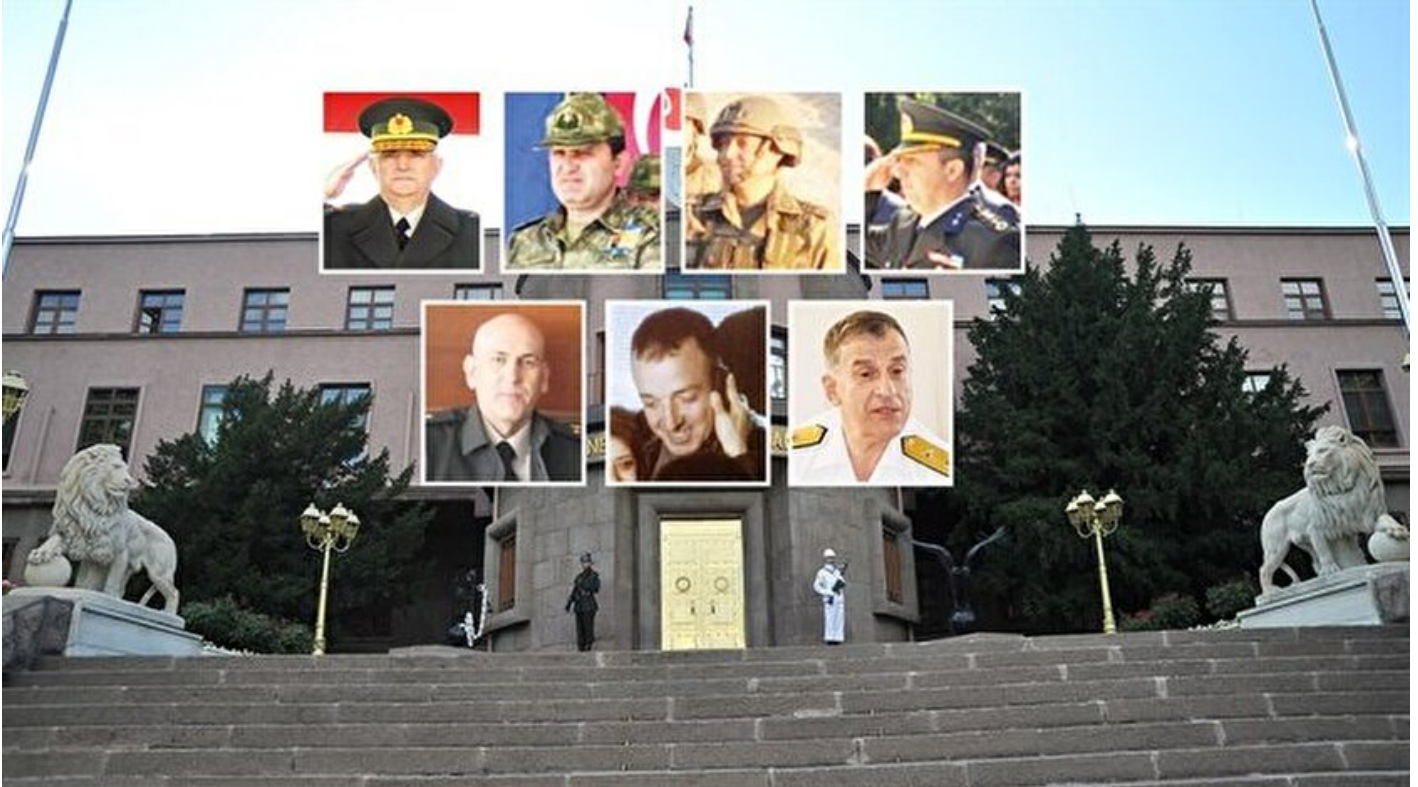
Generaller ByLock'tan emekli

Kıymet Sezer · 23 Ağustos 2017, 04:01 · Son Güncelleme: 23 Ağustos 2017, 13:28 · Yeni Şafak