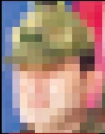
■ 48. Hudut Tugay Komutanı Tuğgeneral Rıdvan Yücel Yıldız