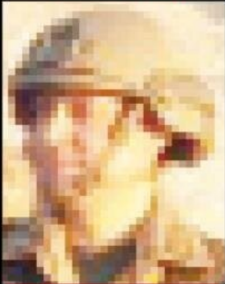
■ 4. Komando Tugay Komutanı Tuğgeneral Ömer Faruk Cantenar