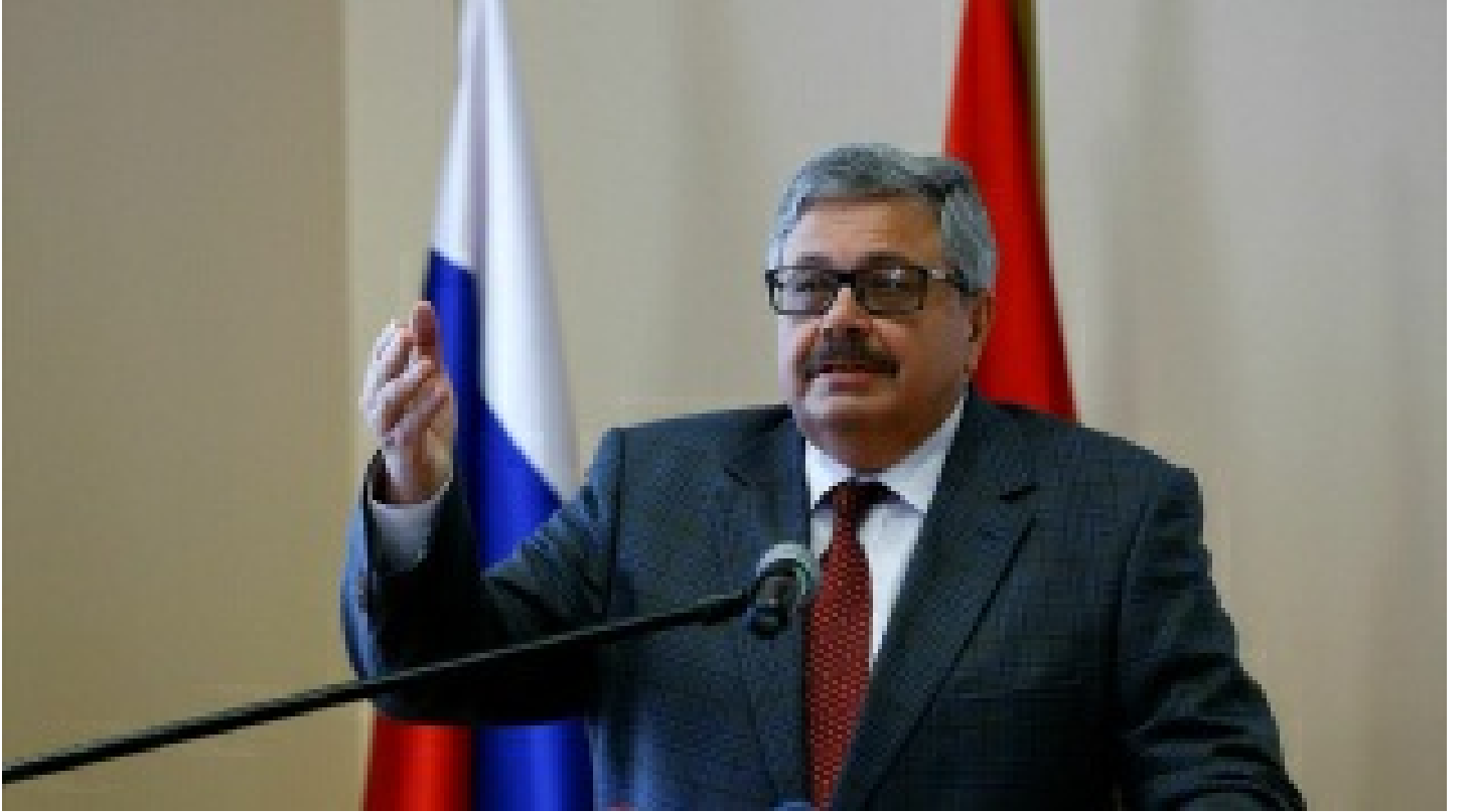
Rus Büyükelçi Yerkov: Türk-Rus ilişkilerini yıkmak için gösterilen çabaları biliyorum