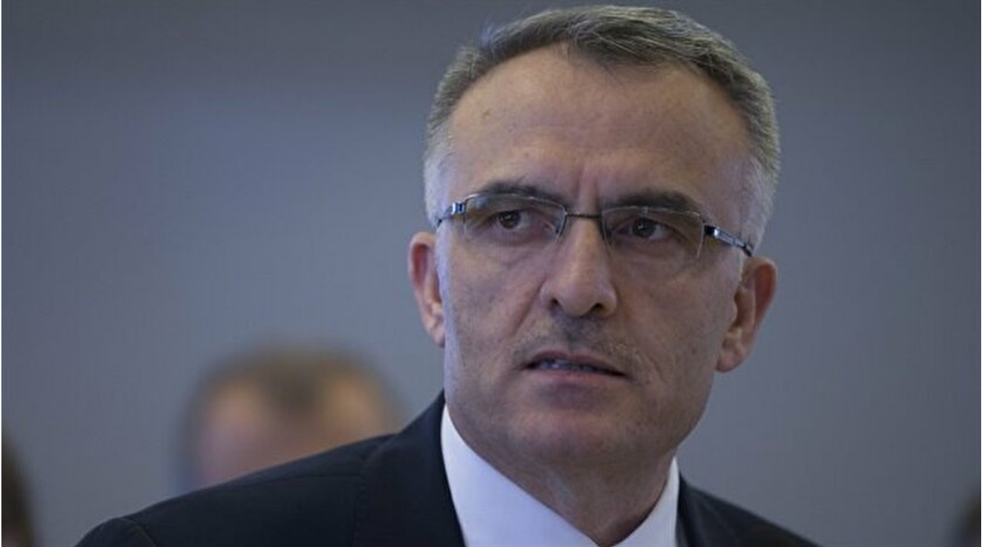
Maliye Bakanı Naci Ağbal

Haber Merkezi · 30 Ekim 2016, 09:52 · Son Güncelleme: 30 Ekim 2016, 15:25 · AA