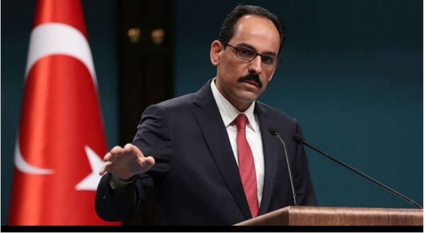
Cumhurbaşkanlığı Sözcüsü İbrahim Kalın

hareket etmemesi için ABD'ye kapatılmasını sorusunu gündeme taşıdı. Bu kapsamda Cumhurbaşkanlığı Sözcüsü İbrahim Kalın bugün yapmış olduğu açıklamada, "İncirlik'i kapatma hakkı bizim elimizde. Ama önce şartlar değerlendirilir" dedi.