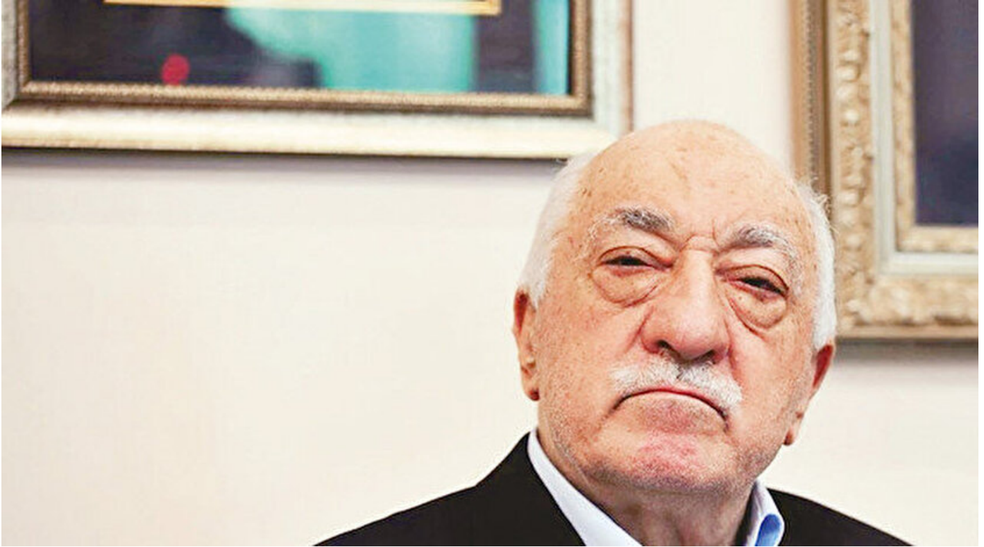
FETÖ teröristbaşı Fetullah Gülen