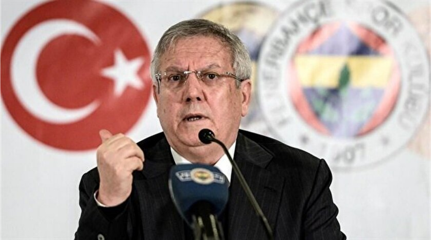
Fenerbahçe Kulübü Başkanı Aziz Yıldırım

Haber Merkezi · 28 Mart 2018, 23:40 · Son Güncelleme: 29 Mart 2018, 00:11 · AA