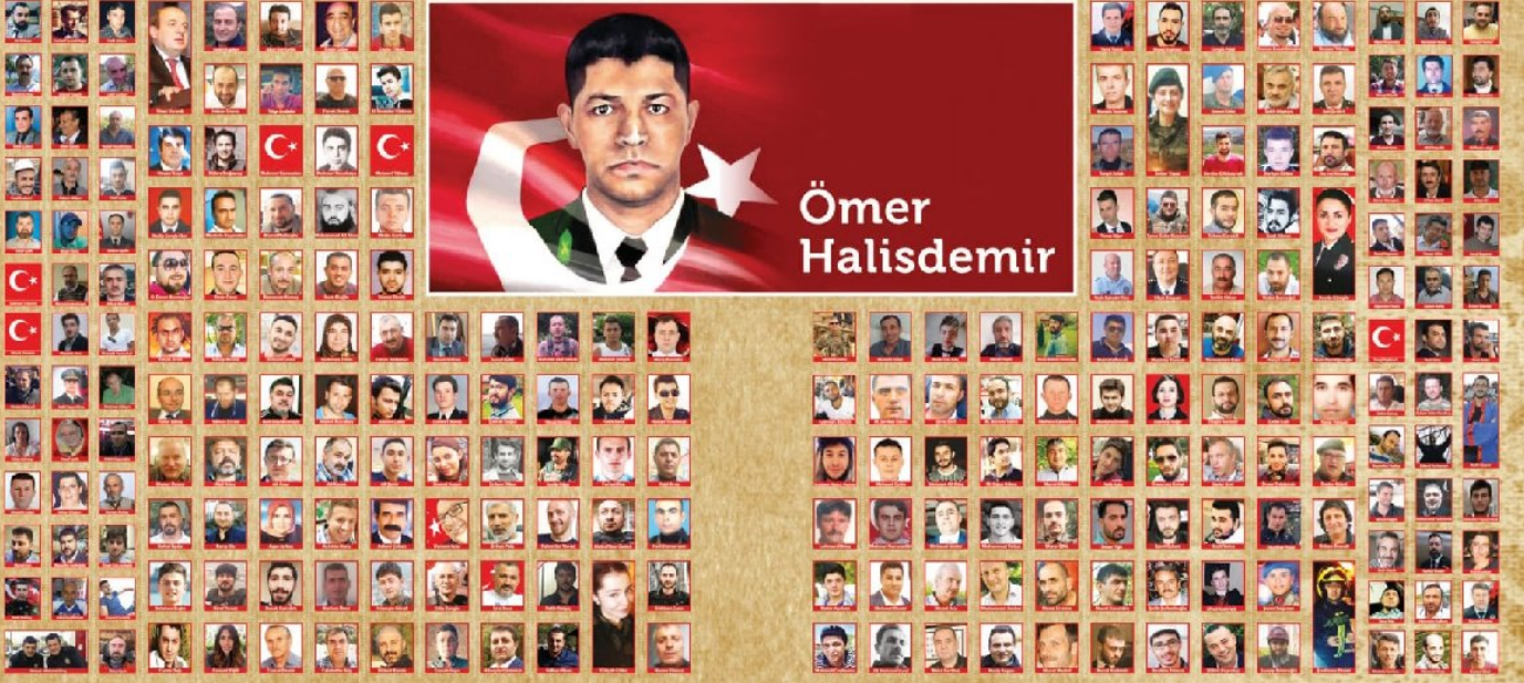
FOTO: 15 Temmuz Darbe Girişiminin Arkasındaki FETÖ, Yargıtay Cumhuriyet Başsavcılığı

Saat 16.16: Kara Havacılık Komutanlığı'nda görevli bir subay MİT'e giderek, FETÖ üyesi askerler tarafından MİT Müsteşarı Hakan Fidan'ın alınması için kuruma saldırı olacağını ihbar etti. Fidan, Genelkurmay 2. Başkanı Orgeneral Yaşar Güler'i telefonla aradı, konu hakkında bilgi verdi.