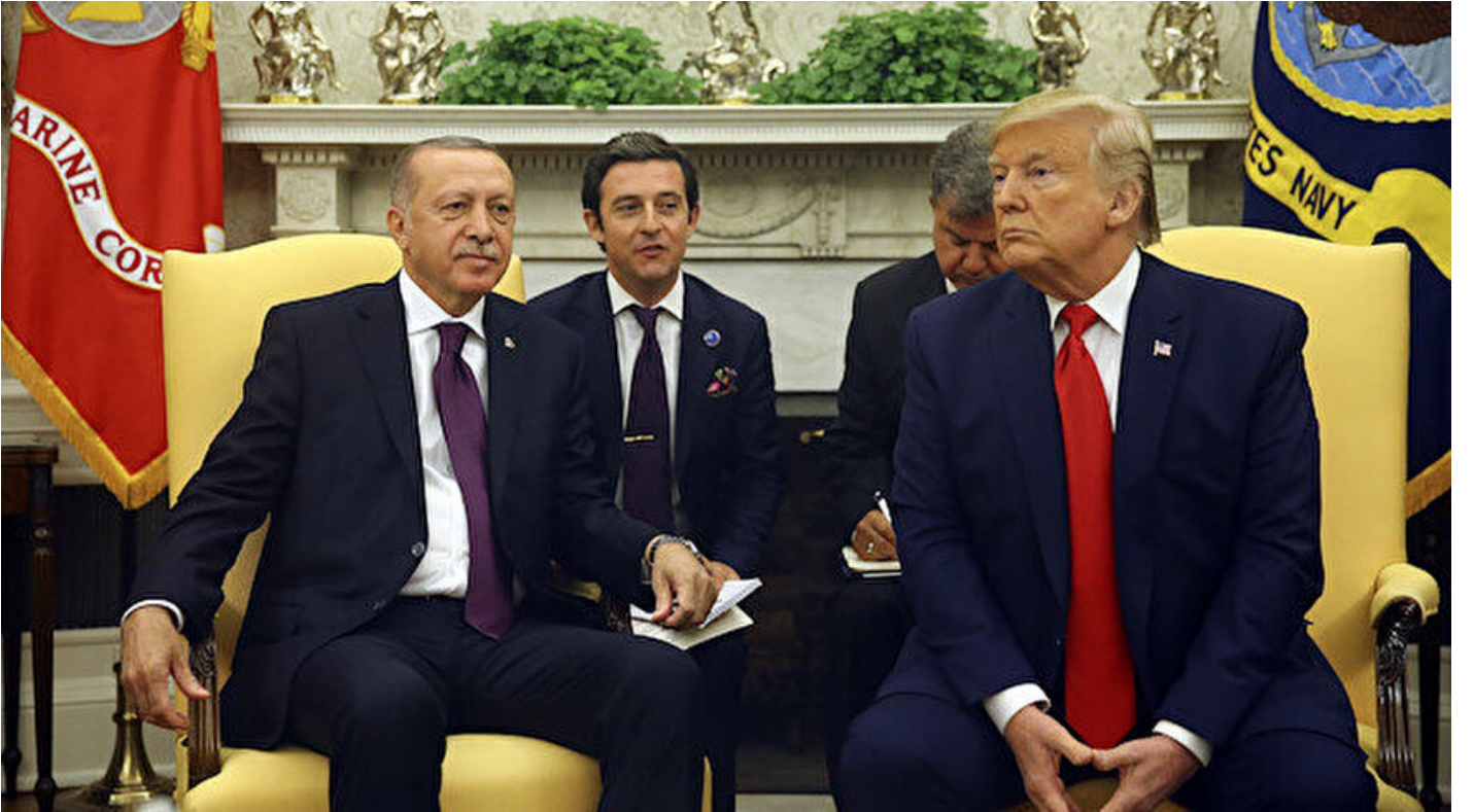
Cumhurbaşkanı Erdoğan ve ABD Başkanı Trump

Haber Merkezi · 14 Kasım 2019, 00:05 · Son Güncelleme: 14 Kasım 2019, 01:14 · Yeni Şafak