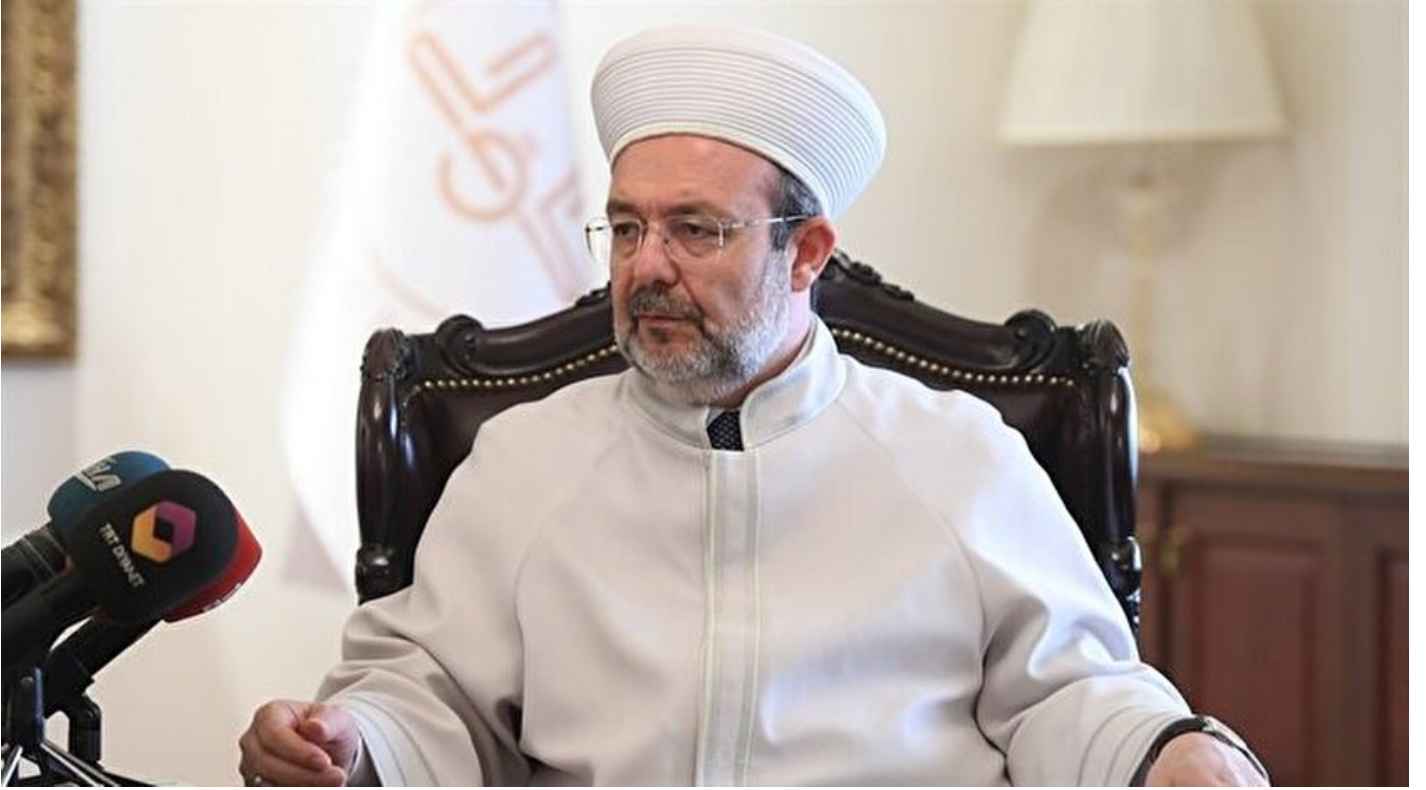
Diyanet İşleri Başkanı Mehmet Görmez

Haber Merkezi · 18 Mayıs 2017, 14:00 · Son Güncelleme: 18 Mayıs 2017, 15:16 · AA