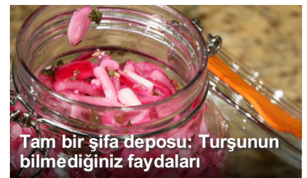
Tam bir şifa deposu: Turşunun bilmediğiniz faydaları