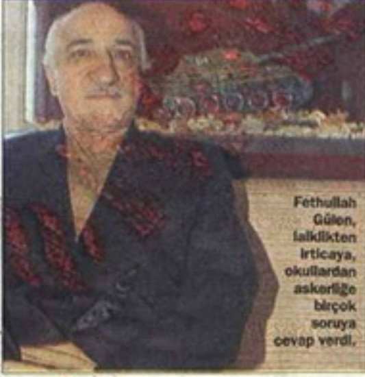
Fethullah Gülen, laiklikten İrticaya, okullardan askerliğe birçok soruya cevap verdi.

Son günlerin en çok tartışılan adamı Fethullah Gülen soruları cevapladı