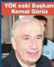
YÖK eski Başkanı Kemal Gürüz

SUÇU: Ergenekon Terör Örgütü'ne üye olmak ve hükümete karşı darbeye teşebbüs etmek... CEZASI: 34 yıl 8 ay