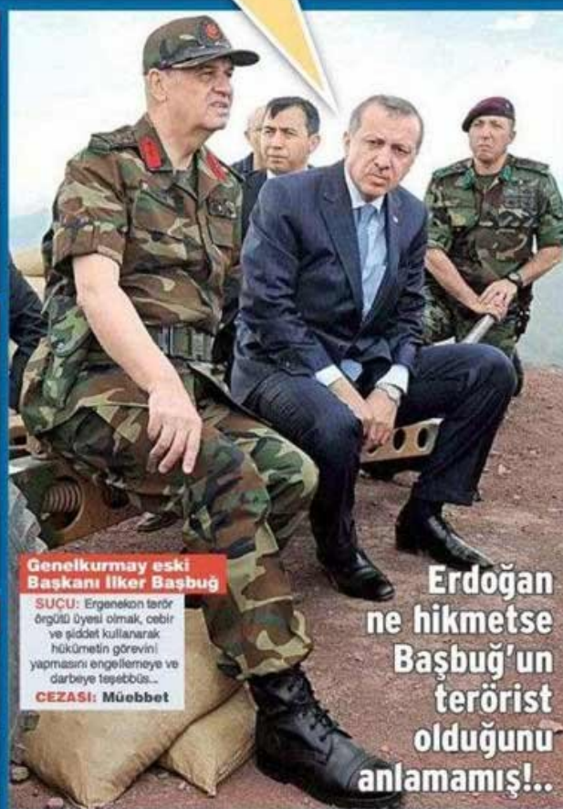
Genelkurmay eski Başkanı İker Başbuğ

SUÇU: Terör örgütüne üye olmak, hükümeti cebir ve şiddet kullanarak yıkmaya teşebbüs... CEZASI: 29 yıl 7 ay