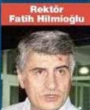
Rektör Fatih Hilmioglu

SUÇU: Cebir ve şiddet kullanarak hükümetin görevini yapmasını engellemeye ve darbeye teşebbüs... CEZASI: 13 yıl 11 ay