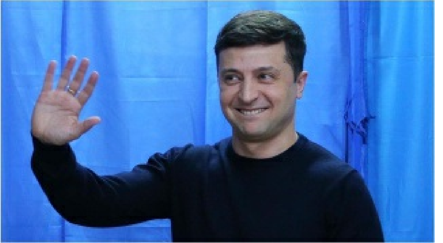
Zelenskiy Ukrayna'dan ayrıldı mı?