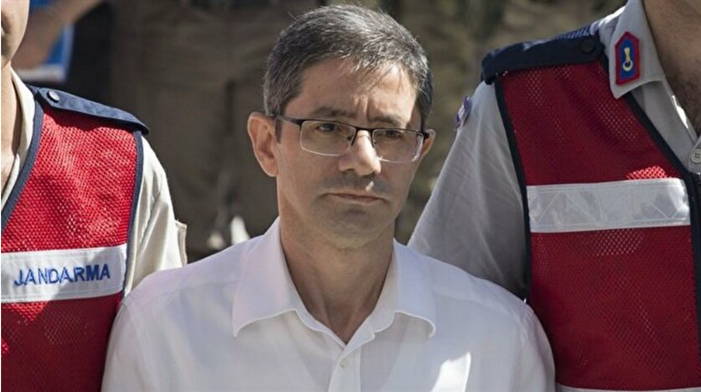
FETÖ'nün sivil imamı Kemal Batmaz

Haber Merkezi · 03 Kasım 2017, 14:16 · Son Güncelleme: 03 Kasım 2017, 14:24 · AA