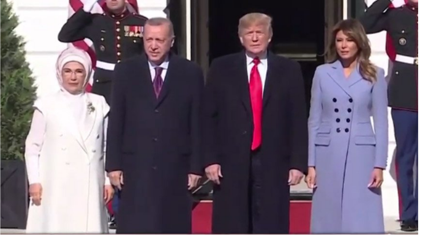
Cumhurbaşkanı Recep Tayyip Erdoğan ve eşi Emine Erdoğan'ı, Başkan Donald Trump ve eşi Melania Trump Beyaz Saray'da karşıladı.