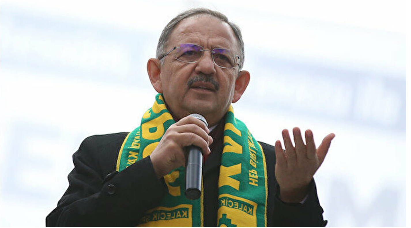
AK Parti Ankara Büyükşehir Belediye Başkan adayı Mehmet Özhaseki

Haber Merkezi · 01 Nisan 2019, 09:16 ·