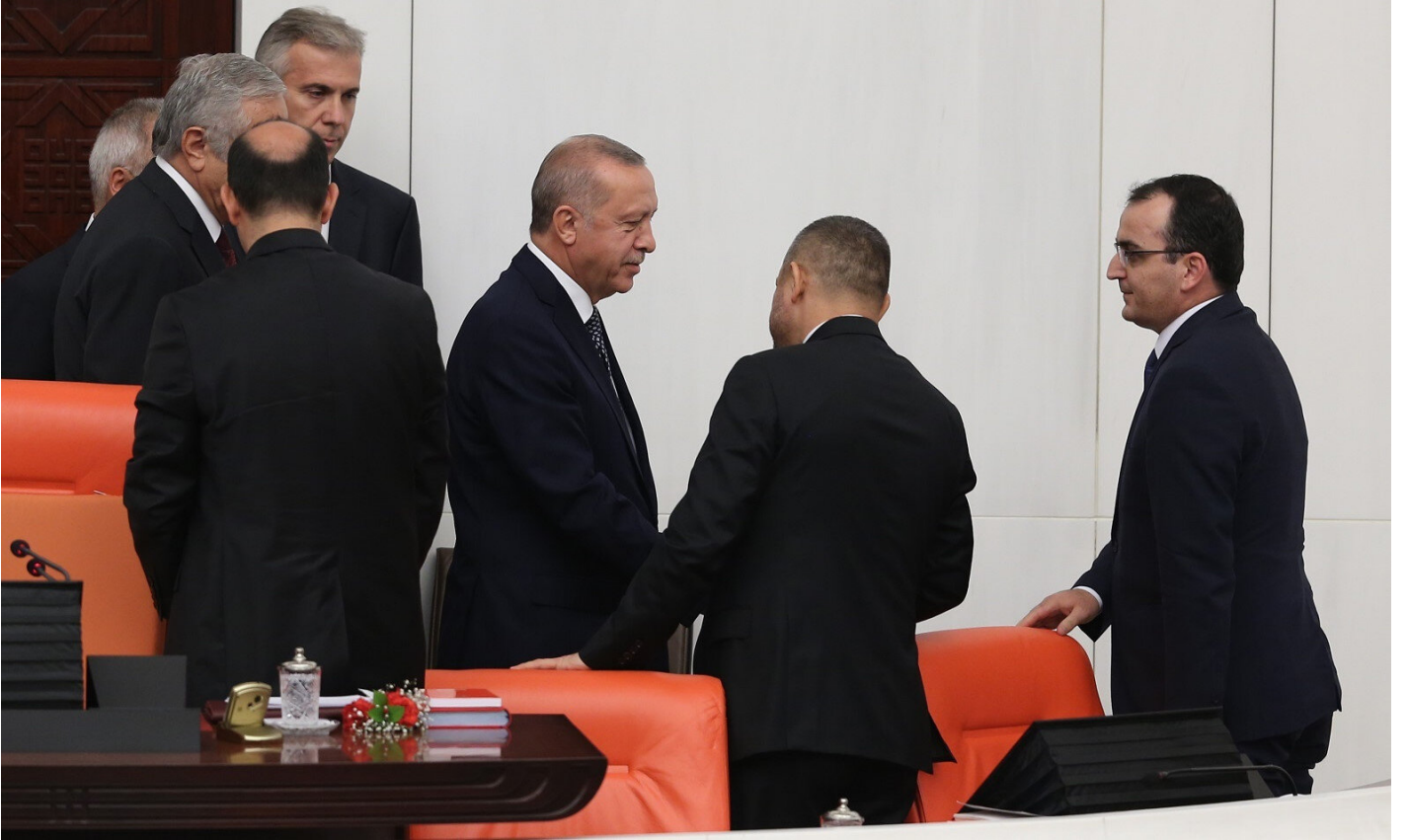
Cumhurbaşkanı Erdoğan, 27. Dönem 3. Yasama Yılı'nın açılışı dolayısıyla TBMM Genel Kurulunda geldi.

İşte bunun için her fırsatta bir olacağız, iri olacağız, diri olacağız, kardeş olacağız, hep birlikte Türkiye olacağız diyoruz. İşte bunun için terörle ve şiddetle arasına mesafe koyan tüm kesimleri, milli meselelerde aynı ortak paydada buluşmaya davet ediyoruz. Bu hissiyatla hareket eden herkesle ülkemizin, bölgemizin ve dünyanın tüm meselelerini konuşmaya, görüşmeye, birlikte hareket etmeye hazırız. Milletimizin ve onların temsilcileri olan siz milletvekillerinin sesine hiçbir zaman kulağımızı ve yüreğimizi kapatmadık, kapatmayacağız. Yeter ki siyasi konulardaki rekabetimizi ve farklılıklarımızı, ülkemize ve milletimize karşı olan sorumluluklarımızın önüne geçirmeyelim. İnşallah önümüzdeki yasama dönemi, Meclis çatısı altında bu yönde örnek bir iş birliği sergileyeceğimiz bir devir olarak tarihe geçecektir."