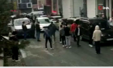
Uçan tekmeli kavga: Kaldırım taşları havada uçtu