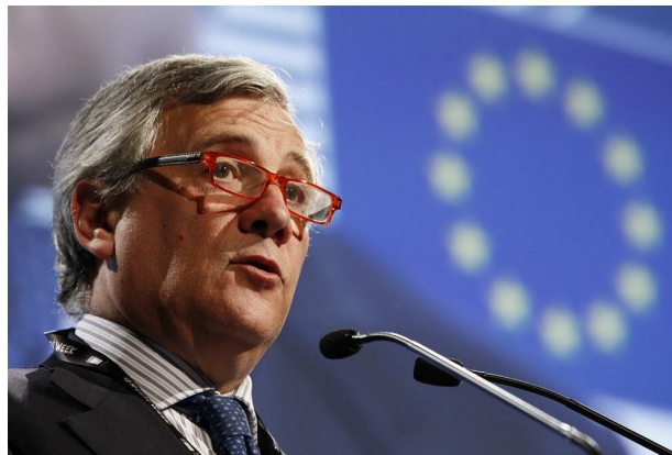
KARŞILIĞINI GÖRECEKLER Antonio Tajani