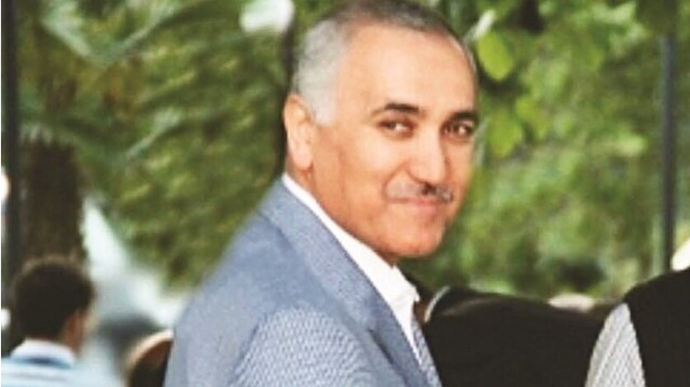
FETÖ firarisi Adil Öksüz

Haber Merkezi · 19 Haziran 2017, 04:00 · Yeni Şafak