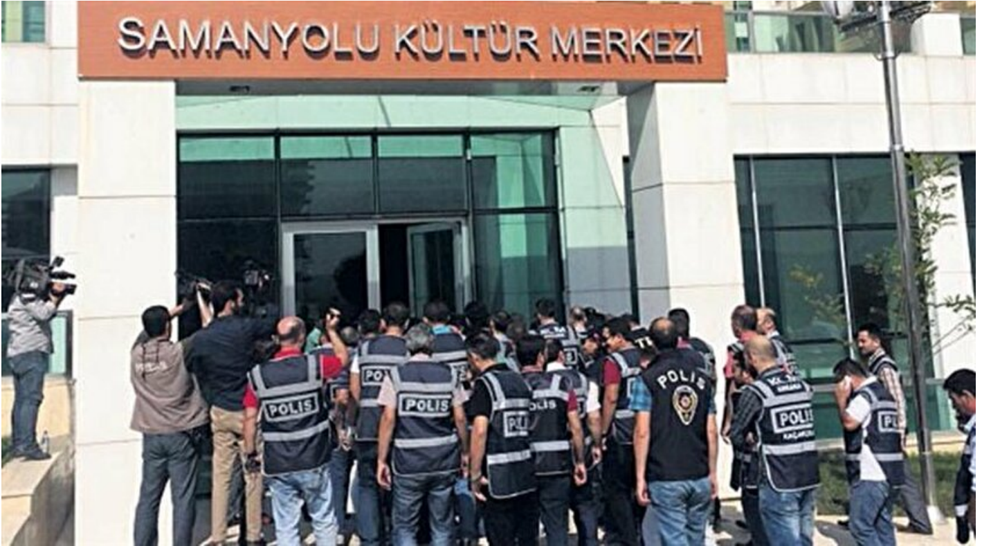
Okulda FETÖ CIA buluşmaları

Haber Merkezi · 19 Temmuz 2017, 04:00 · Son Güncelleme: 19 Temmuz 2017, 09:50 · Yeni Şafak