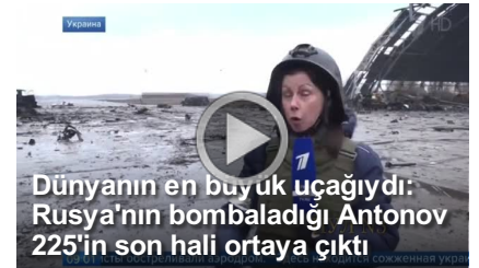
Dünyanın en büyük uçağıdı: Rusya'nın bombaladığı Antonov 225'in son hali ortaya çıktı