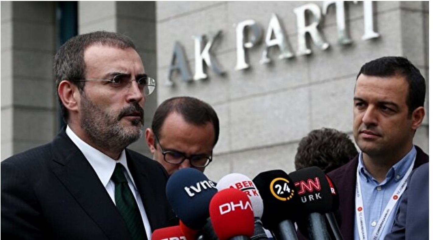
AK Parti Genel Başkan Yardımcısı ve Parti Sözcüsü Mahir Ünal